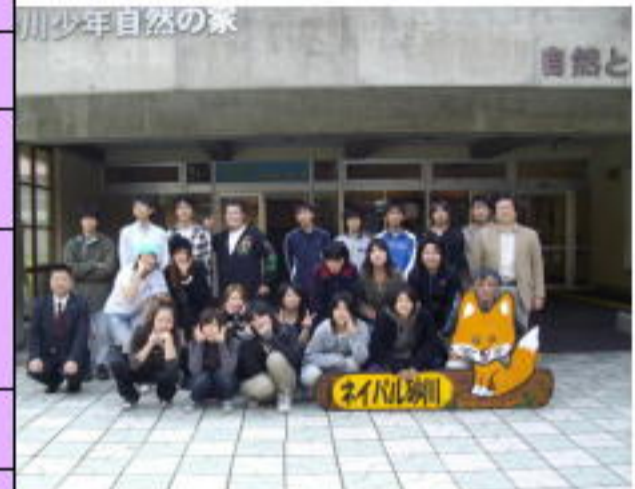
( 宿 泊 研 修 )