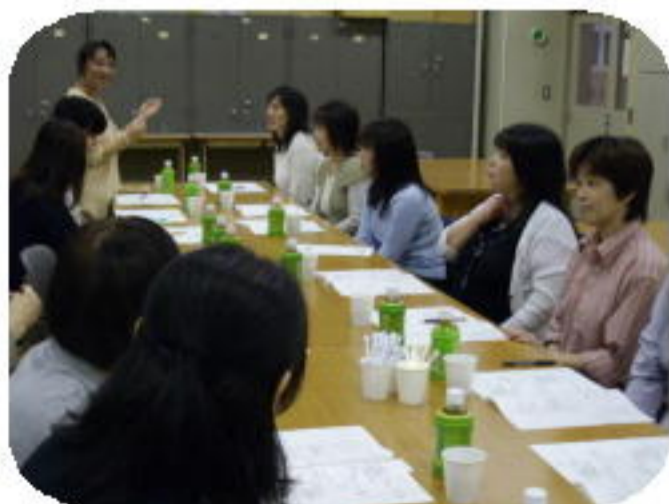
（P T A定時制委員会）