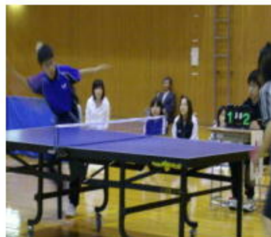
☆卓球部☆ <定体連上川地区大会準優勝>