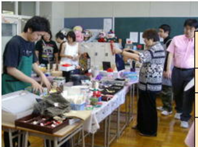
( 学 校 祭 )

学習への意欲を高め、生徒の進路目標の実現を図るとともに、 学校行事や部活動などの充実を図っています。