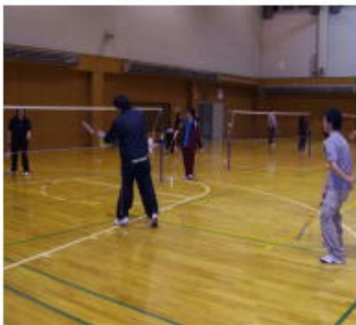
☆バドミントン部女子☆ <定体連全道大会出場>