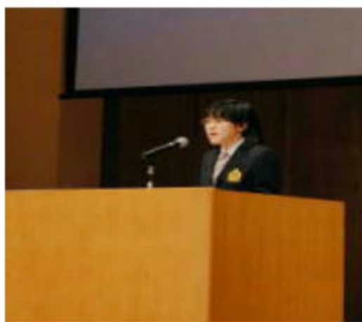
(上川地区生徒生活体験発表大会)