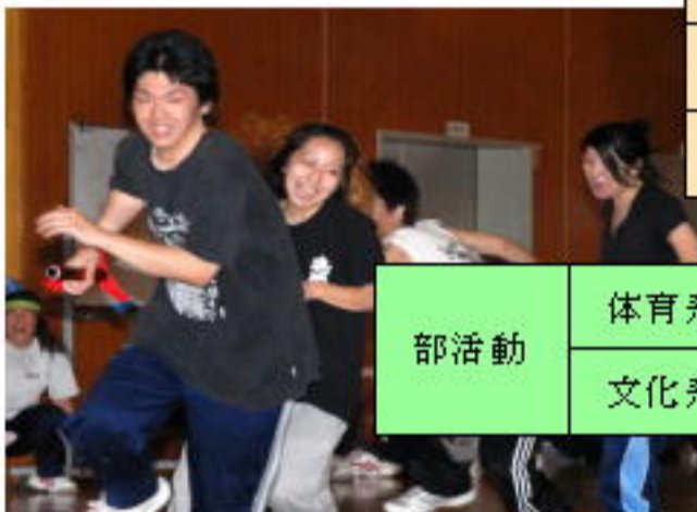
( 体 育 大 会 )