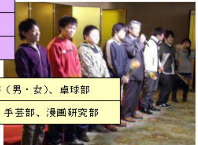
( 卒 業 を 祝 う 会 )